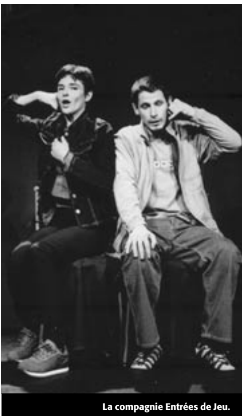
La compagnie Entrées de Jeu.