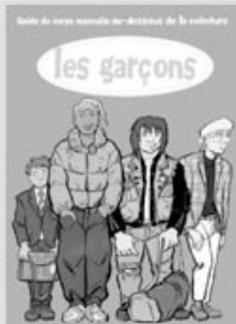
Cette brochure répondant aux questions des jeunes est disponible au Cybercrips.