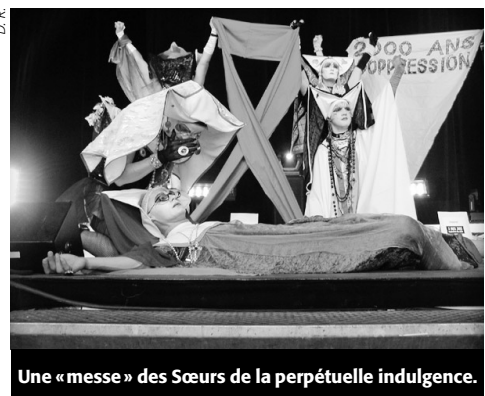
Une « messe » des Sœurs de la perpétuelle indulgence.