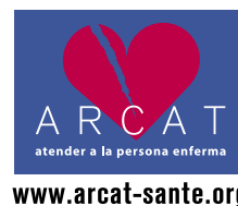
Édition décembre 2003.

Todos los jueves de 1 a 8 de la tarde, en el local de Altaïr París (SEA) 8, rue Saint-Jean - 75017 Paris Tel. : 01 40 08 08 09 Métro : La Fourche