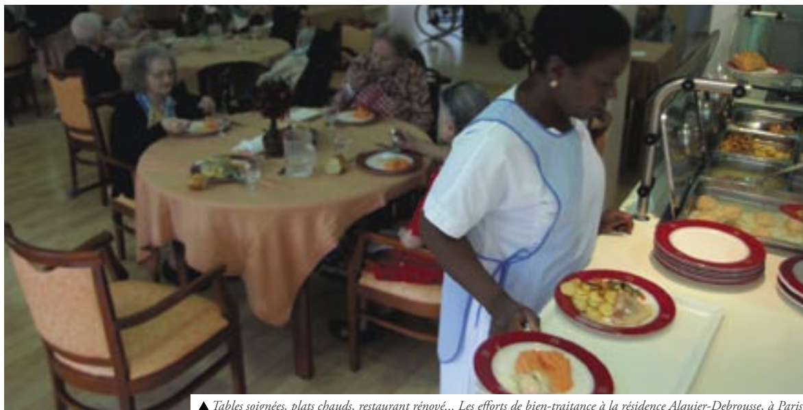
▲ Tables soignées, plats chauds, restaurant rénové... Les efforts de bien-traitance à la résidence Alquier-Debrousse, à Paris.

Bien sûr, toutes ces innovations ne font pas de Paris un éden pour le troisième âge. La canicule de 2003 y a été particulièrement meurtrière. Et l'UMP Françoise Forette ne manque pas de pointer la part déclinante des places habilitées à l'aide sociale dans les Ehpad, et de demander à « aller beaucoup plus loin dans l'intégration des anciens »